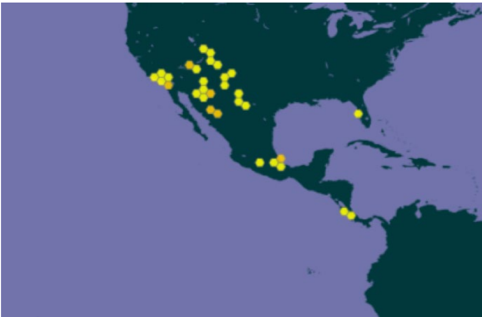
Figura 3. Distribución de Gloveria sp., en México.

Se registra por primera vez al defoliador Gloveria en el ejido La Minerva, municipio de Durango, Dgo. La detección se hizo a principios de 2006 y las colectas de campo se realizaron en marzo de ese año, en rodales de pino piñonero (Álvarez Zagoya & Díaz Escobedo, 2010).