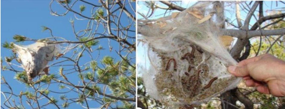
Figura 2. Bolsas de seda donde se refugian las larvas de Gloveria sp.